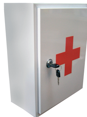
Sadržaj ovog kompleta PRVE POMOĆI je usklađen sa zakonom