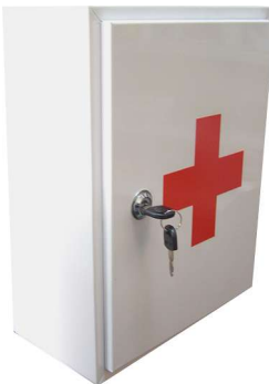
Sadržaj ovog kompleta PRVE POMOĆI je usklađen sa zakonom

Kompleti PRVE POMOĆI se najbrže mogu naručiti telefonom. Kontakt telefon je 011/30-10-200.